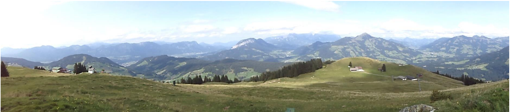
van zijn geliefkoosd plekje in Oostenrijk.